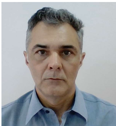
Diretor: Vanderly Janeiro